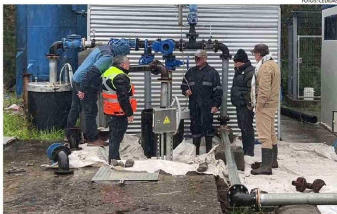
A FINES DEL MES PASADO SE PRODUJO LA EMERGENCIA EN EL SUMINISTRO DE AGUA POTABLE.

el servicio sanitario podrá retomar su funcionamiento, luego de una serie de intervenciones realizadas por un equipo interdisciplinario de la Autoridad Sanitaria que estuvo monitoreando la situación desde el 23 de marzo, cuando se decretó la prohibición tras la detección de hidrocarburos en el sistema de agua rural.