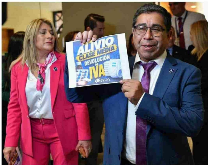
ÁLEX NAHUELQUÍN, DIPUTADO DE LOS LAGOS POR EL PDG, SOSTIENE IMAGEN POR PROYECTO DE LEY DE RECONSTRUCCIÓN. SU PARTIDO SERÁ ACTOR FUNDAMENTAL EN LA TRAMITACIÓN DE LA INICIATIVA.

Finalmente, solicita elevar de categoría el aeródromo de Mocopulli y avanzar en el puente del Canal de Dalcahue para dinamizar la economía chilota.