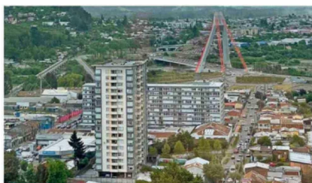
LA CCHC TAMBIÉN CONSIDERA INVERSIÓN EN URBANISMO EN TEMUCO.

su finalización definitiva, obras que consideran unos cuatro mil puestos de trabajo.