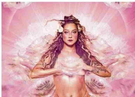
DENISE ROSENTHAL MOSTRará SU NUEVO DISCO, "SUPERNOVA".