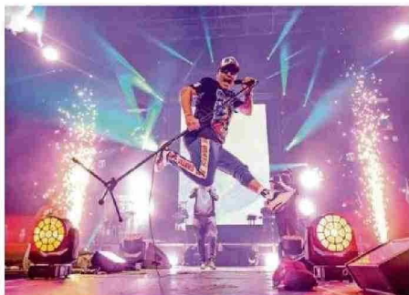
DAMAS GRATIS TRAERÁ LA CUMBIA VILLERA DESDE ARGENTINA.

Tiraje: 16.000 Lectoría: 82.502 Favorabilidad: No Definida