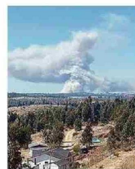
INCENDIO EN CAMINO HUINCA.

● Dos incendios forestales localizados en Casablanca y San Antonio movilizaron durante la jornada de ayer a equipos de Conaf y Bomberos, con apoyo municipal, para atacar estos siniestros. El de mayor afectación se ubicó en San Antonio, específicamente en el sector Camino Huinca, hasta donde se desplazaron brigadas, aeronaves, incluyendo el Boeing 737-3H4 "Fireliner", y carros bomba, acción que permitió