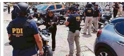
MAYORÍA DE INFRACTORES SON DE NACIONALIDAD VENEZOLANA.