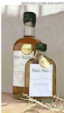
En el proceso usan material reciclado.

rar el licor, pero no fue suficiente. Por esto postularon y obtuvieron un fondo de capital semilla de Corfo de $ 15 millones, con lo cual instalaron energía solar, pues están en un sector sin electricidad; y construyeron los talleres para procesar el material vegetal que es cosechado de las plantas silvestres, pero tomando diversas medidas para ayudar a la sostenibilidad de la especie endémica.