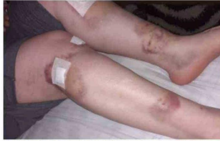
ALGUNOS TRABAJADORES HAN SIDO MORDIDOS EN AMBAS PIERNAS.

al mes reportan desde la empresa que ejecuta los trabajos de limpieza en la ciudad, donde principalmente las víctimas son los auxiliares de aseo que retiran las bolsas de las casas.