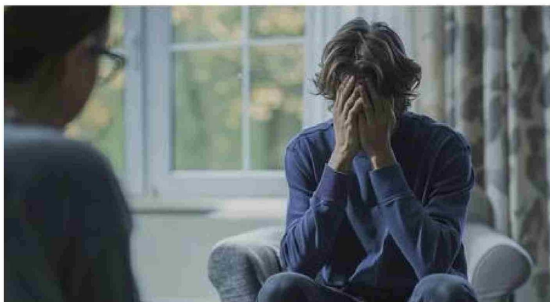
El estrés crónico eleva el riesgo de enfermedades como hipertensión, obesidad, depresión, trastornos del sueño y problemas inmunológicos.

El estrés crónico: dura semanas, meses o más. A medida que transcurre la vida, el cuerpo actúa como si estuviera amena-