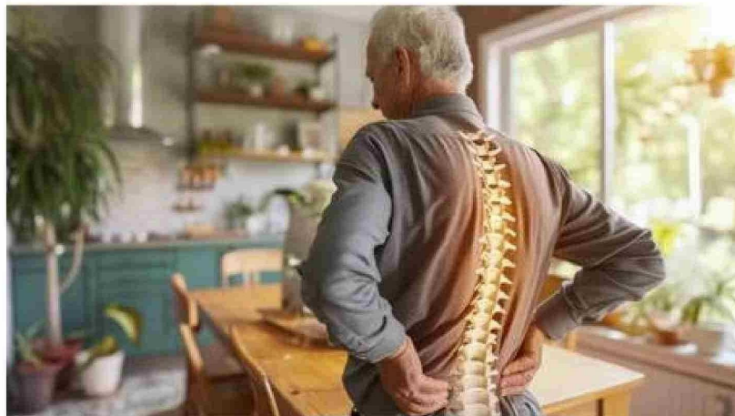
El estrés emocional genera contracturas, especialmente en áreas cervical y lumbar, manifestándose físicamente a través de acortamientos musculares que causan dolor.

La experta señaló que la pandemia de Covid-19 marcó un antes y un después en nuestra relación con el estrés. "No solo transformó la manera en que trabajamos, nos vinculamos y habitamos el tiempo, sino que