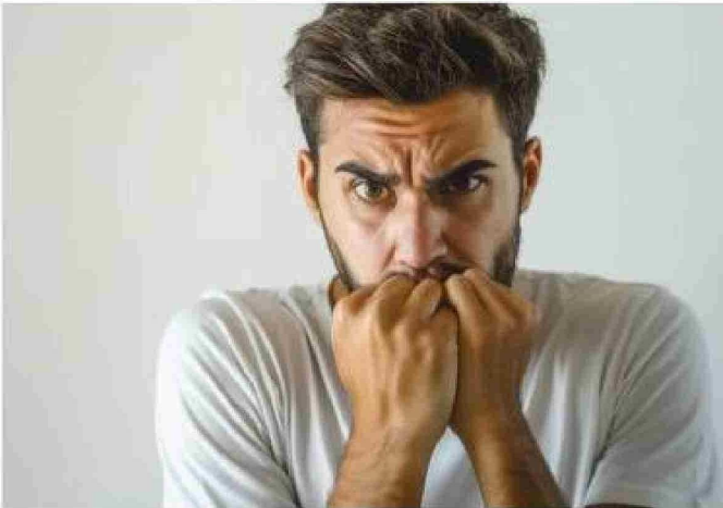
Cuando el estrés se prolonga en el tiempo y no se gestiona adecuadamente, puede volverse tóxico para la salud mental y física.

Título: Día Mundial de la Conciencia sobre el Estrés: las 4 variables que lo desatan y cómo gestionarlo mejor