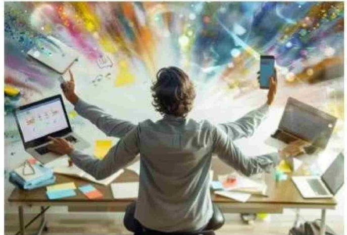
En la adultez media se acumulan múltiples responsabilidades como trabajo, crianza y planificación lo que intensifica el estrés crónico.