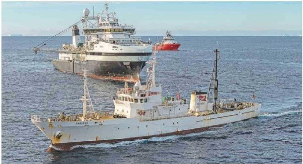
El remolcador Lientur atrás, el pesquero noruego Antarctic Endurance al centro y el buque ambientalista Bandero adelante.

El nuevo incidente comenzó cuando activistas a bordo de botes de goma rápidos (RHIB) se aproximaron al coloso noruego para desplegar anclas de gan-