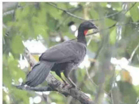
Pava del Chocó en Mashpi Lodge.

Hasta antes de este corredor, por ejemplo, el mono capuchino había desaparecido de la zona y a la pava se la veía en grupos pequeños y en zonas muy específicas. Y, quizá, la mejor señal de regeneración es que desde hace dos años, los monos han regresado y ya se los ve comiendo sus uvas de monte y moviéndose rápido por los bosques, especialmente en la temporada seca, entre junio y septiembre, cuando en las partes altas del Chocó comienza a escasear el agua.