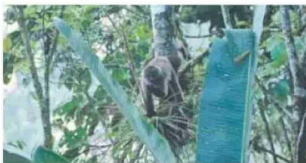
Mono capuchino en la reserva La Hesperia, en el sur de Mashpi.

ra). A cambio, van entregando espacios que se destinan a la restauración ecológica.