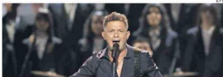
SANZ DICE QUE EL PROYECTO LO TIENE "ENAMORADO".