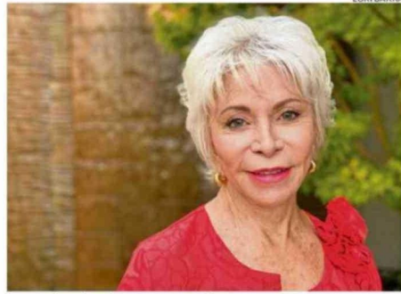
La escritora lanzó ayer un nuevo libro.

Con eso, nació la idea de hacer una especie de manual. "Pero me quedé pensando en que hay una parte de la escritura que no es un manual: que es la creatividad, que es el proceso interno, emocional, instintivo que yo creo que no solamente se aplica a la escritura, se aplica a cualquier