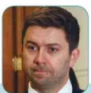
JAIME COLOMA (UDI)