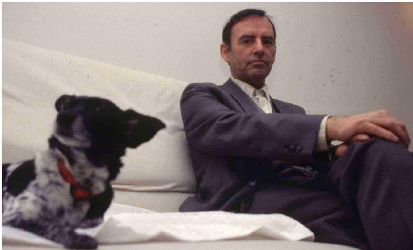
► El poeta Jorge Teillier tenía 16 gatos, pero solo cuidaba a uno llamado Pedro, contó al programa El Mirador, de TVN, a inicios de los 90.