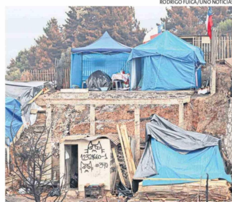
VECINOS BUSCAN RECUPERARSE TAMBIÉN EN LO EMOCIONAL.

"Ha sido muy, muy difícil. La gente te dice: 'es lo material', pero no saben todo el sacrificio que hay detrás de eso. Fueron años de espera, esperamos dieciséis años esa casa. Dieciséis años y perderlo todo en un segundo es muy doloroso",