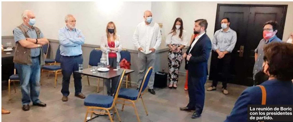
La reunión de Boric con los presidentes de partido.

No habló de una fórmula específica. Las conversaciones más detalladas podrían comenzar esta semana.