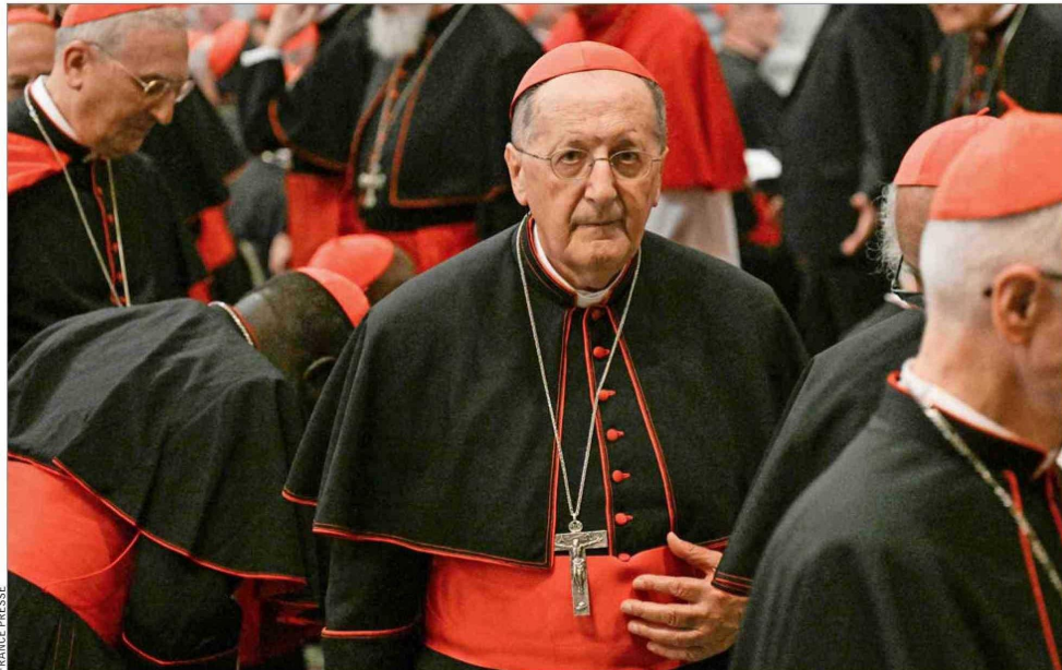
EL CARDENAL STELLA , quien no vota en el cónclave ya que tiene 81 años, hizo una inesperada crítica a Francisco.

Lo acusó de “haber pasado por alto la larga tradición de la Iglesia”, que vincula el poder de gobierno con los órdenes sagrados, y de haber “impuesto, en cambio, sus ideas”, al permitir por primera vez que laicos y mujeres puedan tener cargos de gobierno en la curia romana. Criticó, así, la constitución apostólica “Predicad el Evangelio”, con la que