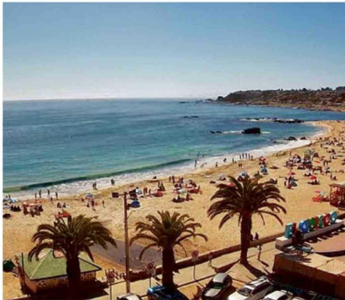
EN EL QUISCO AUMENTÓ EL PÚBLICO, PERO NO EN LOS NIVELES ESPERADOS POR LOS COMERCIANTES.