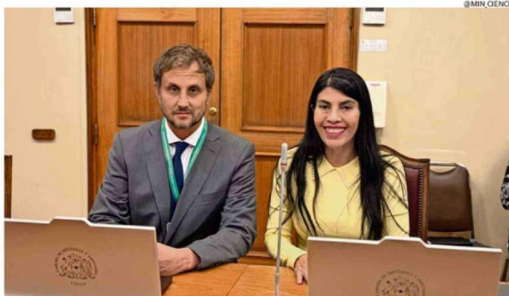
LA OPOSICIÓN CALIFICÓ COMO “PREOCUPANTE” LA VALORACIÓN DEL GOBIERNO AL TRABAJO DE ESTE RAMO.

En una nota escrita entregada a Chilevisión, la exautoridad afirmó que “puedo confirmar por este medio que la orden de diseñar y ejecutar un plan de desvinculaciones ma-