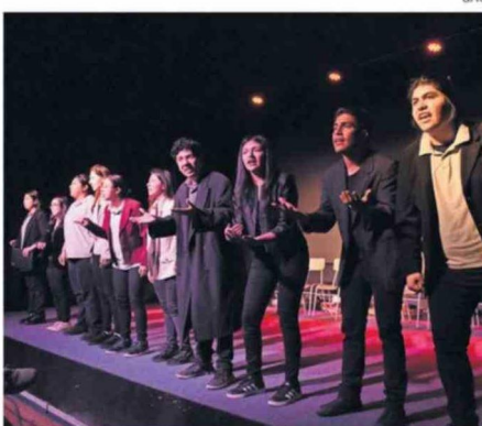
AMAZON / MGM STUDIOS