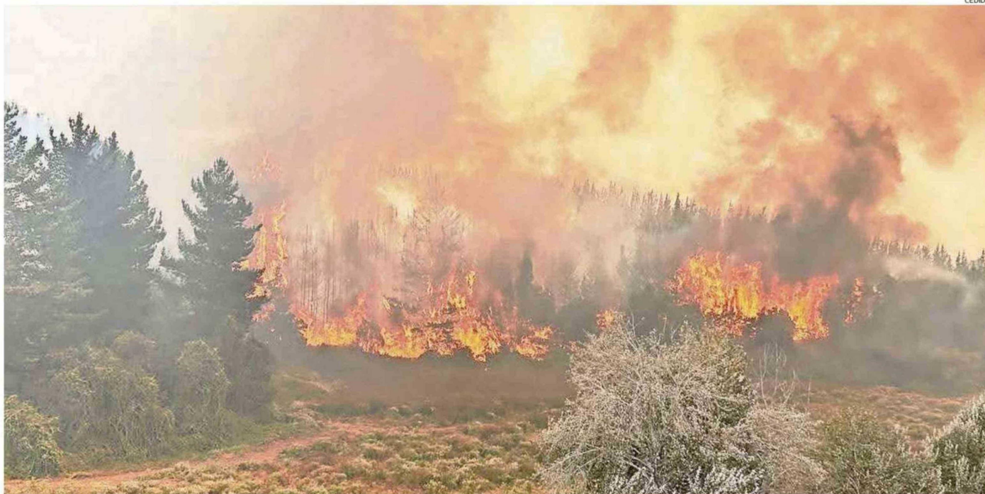
SE CONTABILIZAN 15 INCENDIOS EN COMBATE EN LA REGIÓN.

Tiraje: 2.400 Lectoría: 7.200 Favorabilidad: No Definida