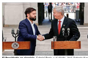
El Presidente en ejercicio, Gabriel Boric, y el electo, José Antonio Kast, analizaron la emergencia, que modificó la agenda de la transición.

■ Afecciones respiratorias y oculares, junto con estrés postraumático, asoman como los principales riesgos para salud de los afectados.