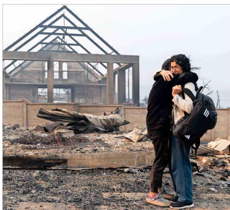
Una madre y su hija se abrazan en la devastada localidad de Torné. Nueve incendios seguían activos ayer en Biobío.

■ En La Moneda, el actual Gobierno y el próximo coordinan reuniones para abordar tareas como la reconstrucción de los sectores arrasados y la atención de los damnificados.