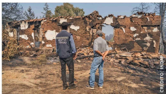
LA AUTORIDAD RECALCÓ LA importancia de completar la Ficha de Afectación Silvoagropecuaria (FAS) para traducir la afectación en ayudas directas.

Finalmente, la directora regional del Indap reconoció que se trata de un trabajo largo y extenuante, pero que es necesario para contar con un mapeo completo de la afectación a nivel regional.