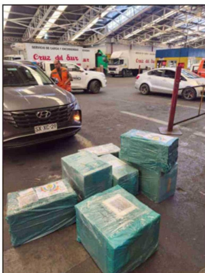
La ayuda fue trasladada por la empresa Cruz del Sur, gracias a la cooperación de vecinos, comercio local y organizaciones comunitarias.