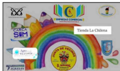
Tiendas comerciales que permitieron dejar cajas para la recolección de útiles.