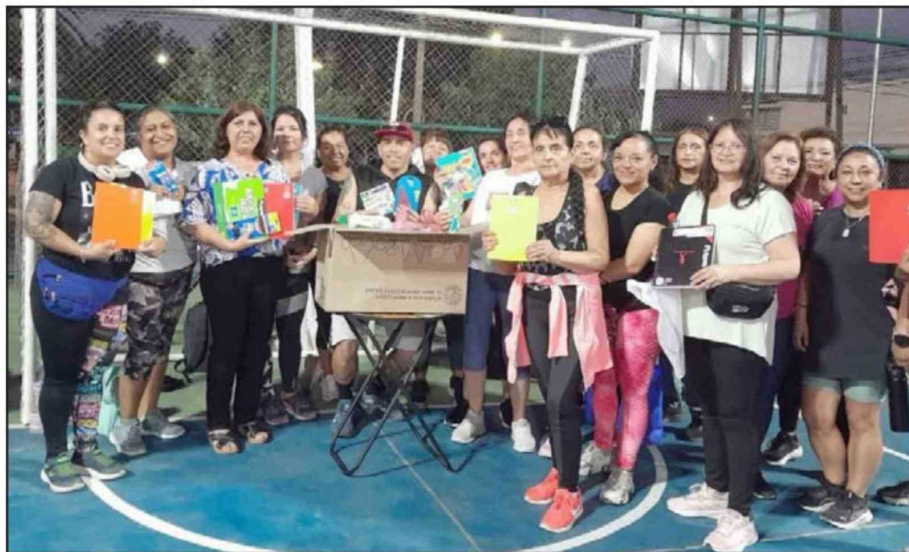
Vecinos de Villa El Señorial organizando y clasificando la ayuda recolectada.

En detalle, la distribución se realizó en sectores como Villa Miramar y Vista Hermosa, en la comuna de Tomé, lugares donde, según explicó la organizadora, no