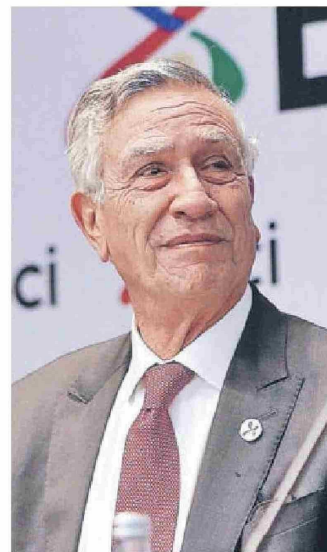
El patriarca cumple 73 años, pero está lejos del retiro, dicen quienes lo conocen.