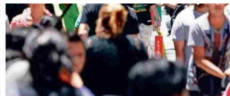
SE ESPERA QUE EN 2070 LA POBLACIÓN DEL PAÍS SEA DE 16.972.558.

En esa línea planteó que "algunos países estamos estancados porque se ha tolerado demasiado tiempo la mediocridad, la improvisación y la excusa permanente (...). Han fallado los gobiernos, de todos los signos y esto es transversal". Kast agradeció además al presidente de Bolivia, Rodrigo Paz, quien ofreció los puertos terrestres de su país para que Chile se conecte con Brasil en un corredor bioceánico. Antes, Kast destacó la cita con Lula asegurando que "trasciende cualquier diferencia política o ideológica que podemos tener, porque lo que nos mueve a todos es mejorar la calidad de vida de nuestros compatriotas". En ese aspecto dijo que hablaron de corredores en el sector "y mucho de energía renovable". Por X, Lula contó que abordaron "la necesidad de promover la estabilidad regional, fortalecer la seguridad pública e intensificar las acciones conjuntas para combatir el crimen organizado, reconociendo la importancia de la cooperación para enfrentar desafíos comunes". Agregó que espera una cita de cancilleres en los próximos meses.