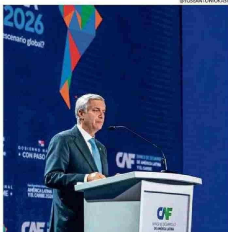
KAST INVITÓ A LOS MANDATARIOS ASISTENTES AL CAMBIO DE MANDO.

El presidente electo José Antonio Kast participó por primera vez en un encuentro como representante del país. Lo hizo en el Foro Económico Internacional América Latina 2026 en Panamá, donde llamó a la unidad latinoamericana, pese a las diferencias políticas y económicas. En los 11 minutos que duró su intervención, Kast mencionó las 25 comitivas que lo acompañan, entre ellas los presidentes de Brasil, Lula da Silva; de Bolivia, Rodrigo Pacheco; de Ecuador, Daniel Noboa; y luego se refirió a la situación de la región. En ese sentido sostuvo que "quiero hablar de una unidad, pero no como una consigna emocional, sino como una obligación institucional (...). La unidad no significa renunciar a lo que uno cree, significa entender el lugar que uno ocupa cuando gobierna. Un presidente no administra una trinchera, un presidente lidera una nación". Luego destacó la reunión que sostuvo Da Silva.