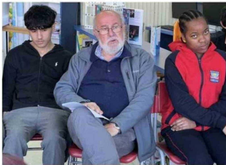
EL ESCRITOR CARLOS TRUJILLO DIALOGÓ CON ALUMNOS DE LICEO.