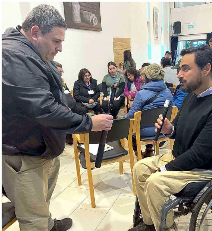
FUNDACIÓN TRIANGULAR REALIZA CAPACITACIONES TERRITORIALES DENOMINADAS "EDUCAR SIN BARRERAS".

1.400 personas están inscritas en el Registro Nacional de Dis- capacidad en Puerto Varas.