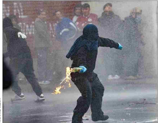
La marcha de la Central Clasista de Trabajadores y Trabajadoras, en cambio, estuvo marcada por los desmanes.

ponente, hasta llegar a Matucana. Un grupo de encapuchados generó una serie de incidentes, destrozando paraderos de buses, luminarias, cámaras de seguridad y señalética. La Prefectura Central de Carabineros también informó que sujetos arrojaron fuegos artificiales en las inmediaciones del metro Unión Latinoamericana. Efectivos de Control de Orden Público (COP) desplegaron un amplio contingente en el sector para hacer frente a los desmanes, utilizando gases lacrimógenos y apoyándose con