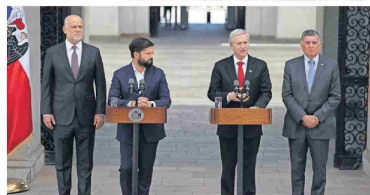
En Lirquén, una de las zonas más afectadas por los siniestros, se realizan labores de remoción de escombros y entrega de ayuda. A la izquierda, Boric y Kast luego de la reunión de coordinación.