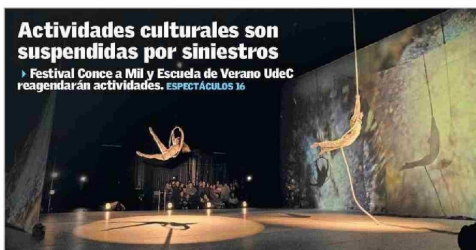
Actividades culturales son suspendidas por siniestros ► Festival Conce a Mil y Escuela de Verano UdeC reanudarán actividades. ESPECTÁCULOS 16