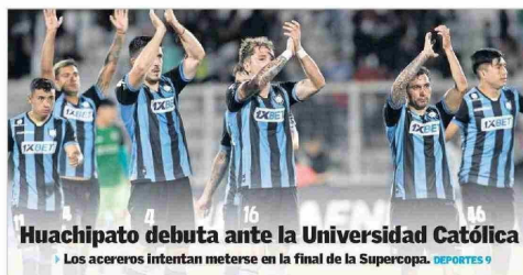
Huachipato debuta ante la Universidad Católica ► Los acereros intentan meterse en la final de la Supercopa. DEPORTES 9