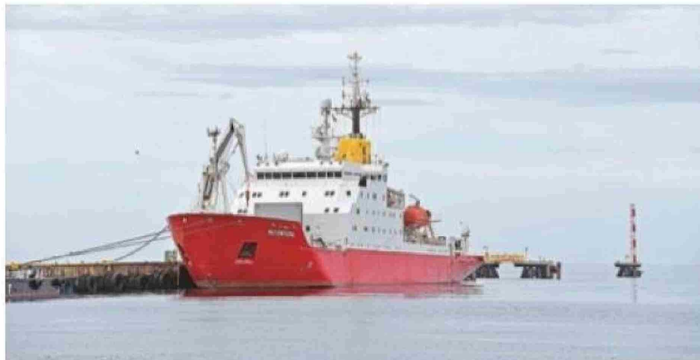
Durante su campaña antártica, el rompehielos ucraniano Noosfera tiene como puerto base Punta Arenas.

Para Dikul, la investigación antártica tiene un rol que va más allá de la academia. "No se