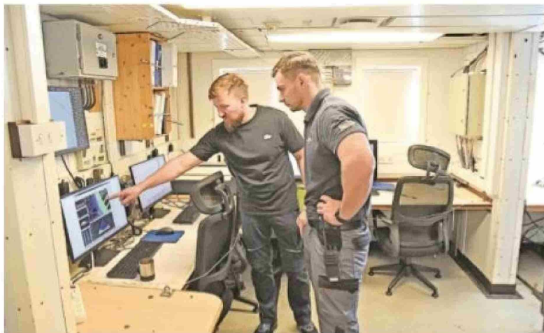
Parte de los equipos con que, desde el Noosfera, se van monitoreando las corrientes y otros datos sensibles de la zonas subantártica y antártica.

» "Este es un programa a largo plazo, que comienza formalmente en 2025 y que proyectamos continuar en los próximos años", señala Dikul, subrayando que solo la continuidad de las mediciones permite construir series de datos confiables y científicamente comparables