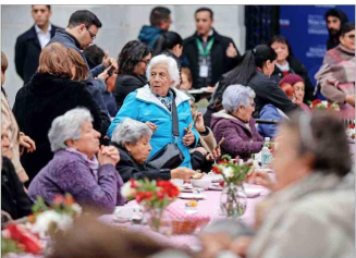
Unos 190 mil adultos mayores con propiedades afectas ya tienen beneficios.

Hay unas 206 mil personas de edad avanzada con propiedades afectas que no tienen beneficios para el impuesto territorial.