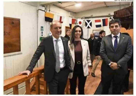
DELEGADA CARRASCO Y DIPUTADO VALENZUELA ACOMPAÑARON A MINISTRO.

"Contar con datos actualizados es fundamental porque permiten orientar, con mayor precisión, las políticas públicas de transporte. Por eso, hemos financiado el 100% de esta iniciativa, con una inversión de 400 millones de pesos, justa-