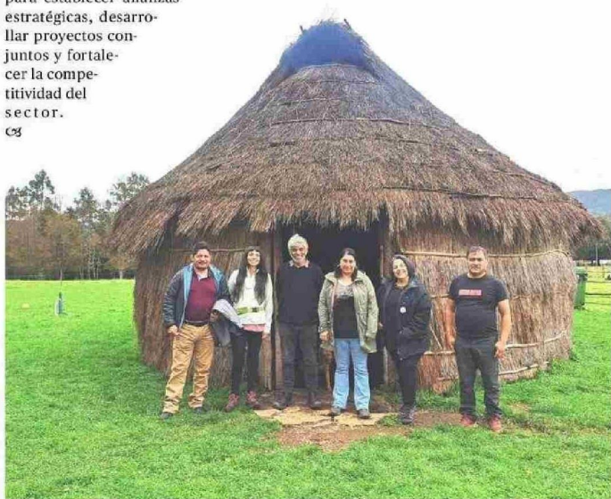
TAMBIÉN SE REALIZÓ UN ENCUENTRO DE TURISMO DE NATURALEZA COMUNITARIA EN INÍPULLI, EN MARIQUINA.