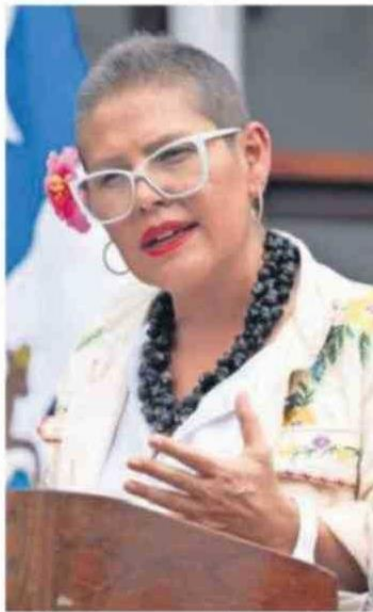
Políticos de oposición y de Chile vamos cuestionaron la salida de la directora de Sernameg.

Apuntó que no hubo explicación alguna sobre las razones de la decisión y que las autoridades entrantes sabían de su diagnóstico