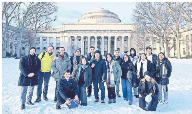
Grupo de visita en Boston durante gira de formación internacional.