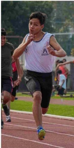
SAID EN PLENA COMPETENCIA, demostrando su potencial como velocista.

E l atletismo angelino continúa en proceso de renovación, con figuras emergentes que comienzan a