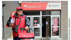
3.757 trabajadores Tenía correos al cierre del año pasado.

En la ley miscelánea que ingresó el gobierno anterior a fin de año —duramente cuestionada por los llamados “amarres”— se propina ampliar el giro de Correos de Chile, permitiéndole hacer labores de logística por medios físicos, digitales o híbridos. El 14 de enero esa norma fue rechazada.