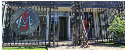
US$ 1,9 millones Proyecta perder la Casa de Moneda en 2026.