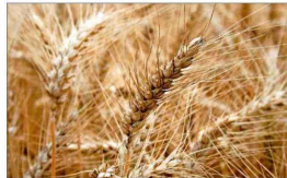
22 funcionarios Tiene Cotrisa y gasta $69 millones mensuales en sueldos.

A comienzos de ese mes el presidente del Partido Republicano y senador, Arturo Squella, señalaba en canal 13: “La única indicación que correspondía ahí era decir correos Correos; dejemos de perder plata”. Y agregaba: “Ya en el mercado hay competencia suficiente para prestar esos servicios, no se justifica que estemos destinando recursos del Estado para mantener una empresa pública que en su minuto puede haber sido necesaria, pero hoy para nada”.