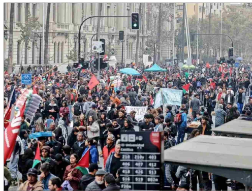
La convocatoria de la CUT, que se desarrolló en un ambiente mayormente tranquilo, instaló un escenario frente al Centro Cultural Gabriela Mistral, en el centro de Santiago. Los desórdenes se concentraron en otros puntos de la Alameda donde se manifestaba la Central Clasista de Trabajadores y Trabajadoras.

El mandatario subrayó que hay más de 900 mil desempleados y 2,5 millones de personas "que viven del trabajo informal" y que "sufren las consecuencias de distintas políticas".