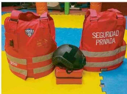
CHALECOS DE SEGURIDAD CERTIFICADOS ANTI CORTES Y CASCOS.

Respecto a los exámenes, argumenta: "Tomamos entre 50 y 60 en una unidad policial. Vamos a las clases, controlamos que profesores y alumnos cumplan horarios; de lo contrario, son retirados sin su acreditación. Y si la empresa no da cumplimiento al manual, se le infracciona al Juzgado de Policía Local y tiene que responder ante un Tribunal por irregularidad a la ley".