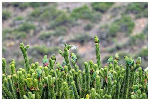
ALTO BIOBÍO. Ubicada en La Araucanía andina, cerca del paso Pino Hachado, esta reserva tiene un paisaje más de estepa patagónica. También existe gran variedad de aves.

metros ida y vuelta y se recorre en unas cinco horas. Es muy poco transitado, pero muy bonito. Diferente a lo que uno está acostumbrado de ver en esta zona”.