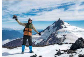
POSTAL. El fotógrafo con el volcán Choshuenco de fondo. Ahora hay un nuevo camino de acceso a esta reserva.