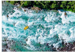
AVENTURA. Ir a los miradores de la Reserva Futaleufú es un gran complemento a los clásicos descensos en rafting.