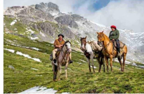
LAGO PALENA. A esta reserva nacional se llega a caballo. El viaje dura unas ocho horas y se hace con arrieros.

"Visitar esta reserva entrega muchas enseñanzas: la principal es que ves en terreno lo dañina que puede ser la acción humana y la importancia de seguir las normas y cuidar estos lugares. Un incendio arrasó con gran parte de estos bosques de araucarias en marzo de 2015, pero se ha ido recuperando. La resiliencia que tienen estos árboles, su capacidad para sobrevivir a catástrofes de esta magnitud, es impresionante.