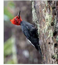
VIDA. El bosque de China Muerta se ha ido recuperando tras el incendio de 2015.

"Nosotros fuimos ahora en verano y llegamos en auto a la entrada misma de la reserva (en invierno puede ser más complejo, cuando cae nieve). Dentro de la reserva está el cálido Refugio Mocho-Choshuenco , donde puedes acampar o quedarte en una tiny house que tienen allí. El refugio está asociado al Club Andino de Valdivia.