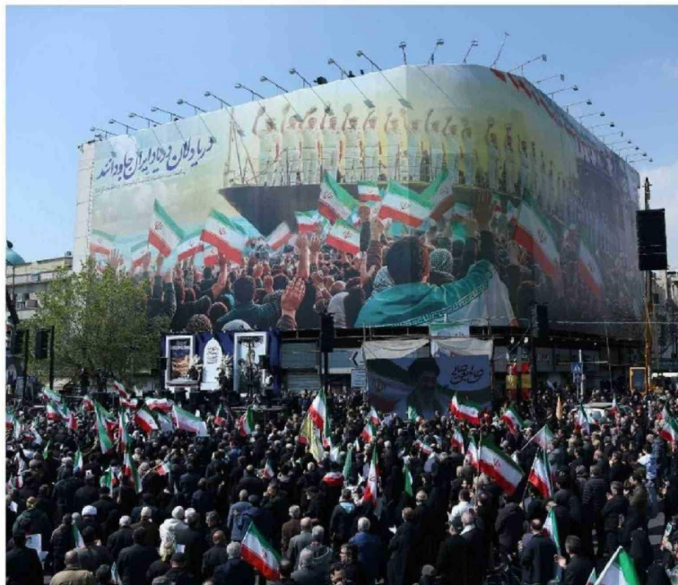
► Manifestación en el centro de Teherán.

"Los estadounidenses no obtendrán nada en una guerra perdida que no hayan ganado en las negociaciones cara a cara", expuso en