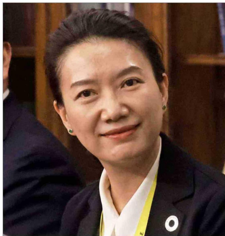
La vicepresidenta sénior de Tianqi Lithium, Wanyu Xiong, en una visita a Chile en 2024.

La china Tianqi Lithium Corporation anunció su intención de vender hasta 1,25% de sus acciones, luego de que la Corte Suprema respaldara el acuerdo con Codelco.