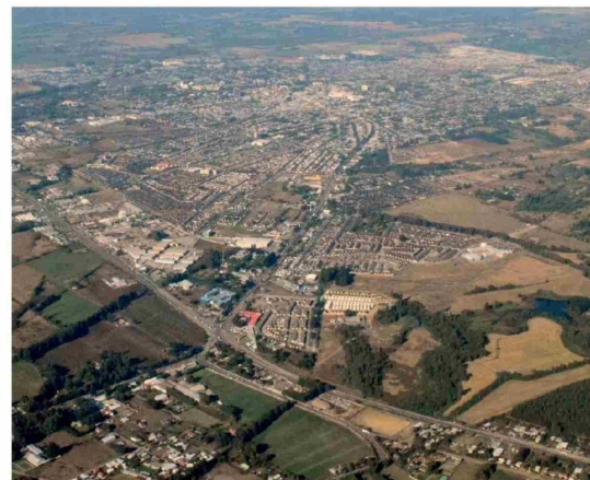
AUTORIDADES Y DIRIGENTES abordaron el estado actual del proyecto en una instancia de coordinación. La obra apunta a descongestionar sectores críticos de Los Ángeles.

Dentro de estos terrenos, se contempla un paño fiscal de aproximadamente 3,7 hectáreas perteneciente al Ejército de Chile, punto que ha generado uno de los principales focos de controversia del proyecto.