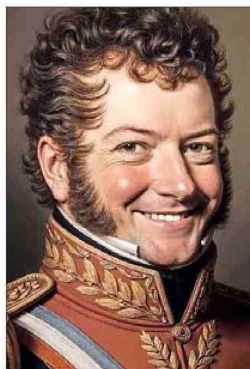
Bernardo O'Higgins aparece sonriendo y galopando.