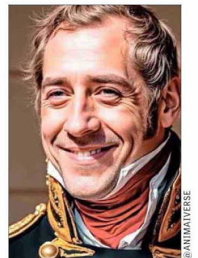
El escocés Thomas Cochrane es retratado en varias épocas.

José Latorre y Óscar Viel. Todos ofrecen como novedad una sonrisa creada por la IA.