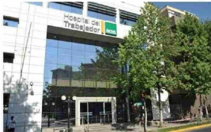
AFECTADOS ESTUVIERON EN EL HOSPITAL DEL TRABAJADOR ACHS.