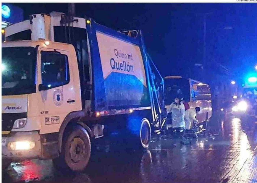
LAS VÍCTIMAS FUERON IMPACTADAS CUANDO VIAJABAN EN LA PISADERA POSTERIOR DEL CAMIÓN, SIN CONTAR CON MEDIDAS DE SEGURIDAD.

El primer trabajador perdió su pierna izquierda a la altura de la rodilla, en el mismo sitio del suceso, mientras que su compañero resultó con deformidad y aplastamiento severo de