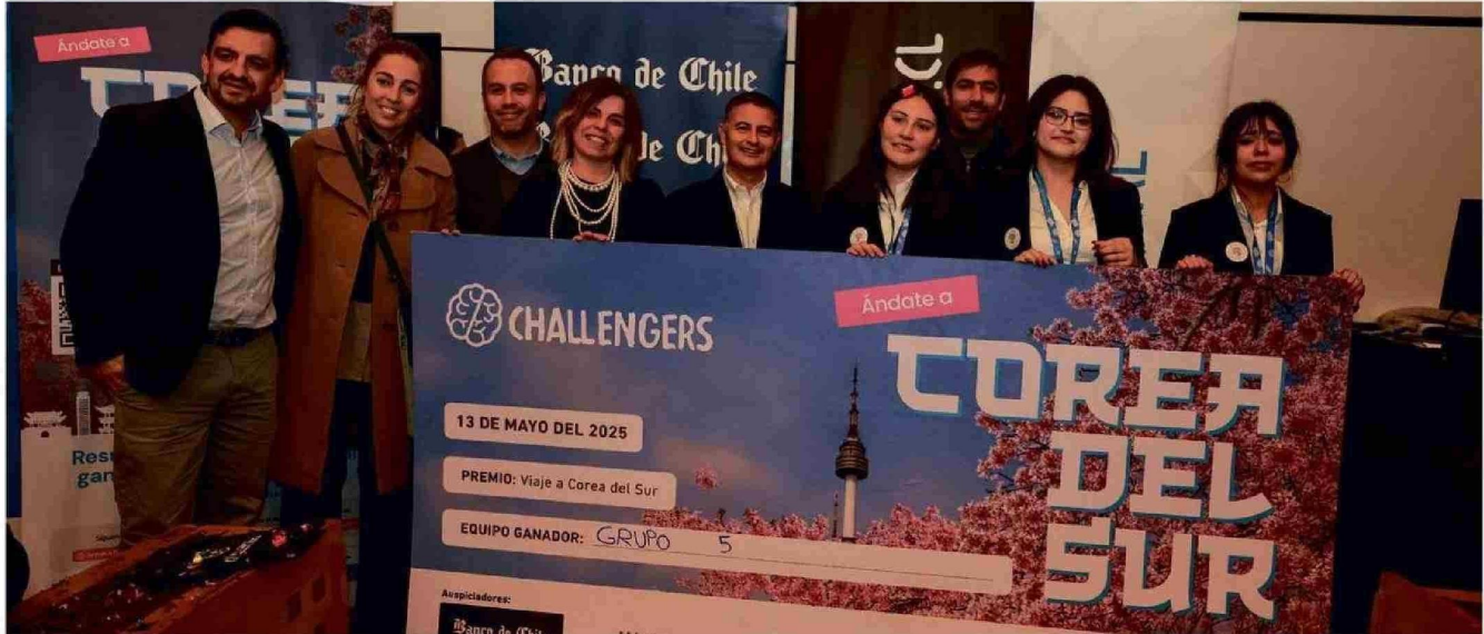
Desde su primera edición, el desafío ha logrado movilizar a más de 150.000 jóvenes de 372 colegios y 27 universidades de todo el país. En la imagen, las ganadoras junto a parte del jurado.

Challengers es organizado por U. de los Andes y Banco de Chile: