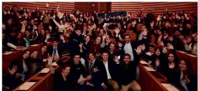
La electrizante final reunió a cerca de un centenar de estudiantes divididos en 22 equipos de colegios y universidades de todo Chile.