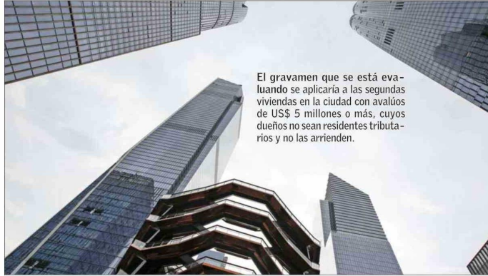
El gravamen que se está evaluando se aplicaría a las segundas viviendas en la ciudad con avalúos de US$ 5 millones o más, cuyos dueños no sean residentes tributarios y no las arrienden.

ra los acaudalados, esto cuenta como algo suave. "Las propiedades residenciales de alto valor suelen estar subgravadas en comparación con otras propiedades residenciales", dice Ana Champeny, de la Citizens Budget Commission, un centro de estudios. El principal efecto probablemente será reducir levemente los precios de las viviendas de mayor valor en la ciudad y quizá empujar a algunos propietarios ausentes a vender a neoyorquinos que podrían darle mayor uso. Pero esto está lejos de ser