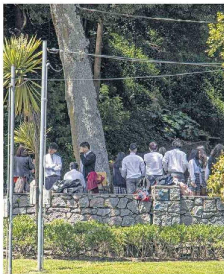
El Senda analizó a los escolares respecto a su consumo de distintas drogas, tanto legales como ilegales.

Desde Senda apelan a la necesidad de mantener un mejor cuidado de drogas al interior de los hogares, por ejemplo del alcohol y distintos medicamentos.