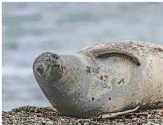
Foca Cangrejera en bahía Fildes.