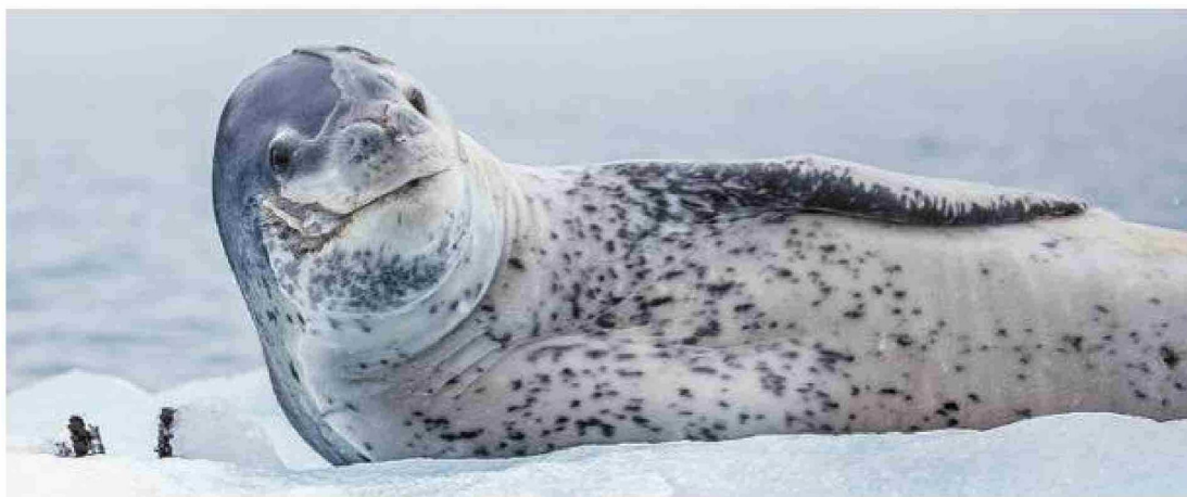
Una Foca Leopardo en las inmediaciones de la base Prat.

al igual que el Lobo fino antártico, necesita un sustrato libre de hielo para reproducirse, razón por la cual en su temporada de Estrógeno y Calor, se acerca a las costas de las islas antárticas y subantárticas para procrear.