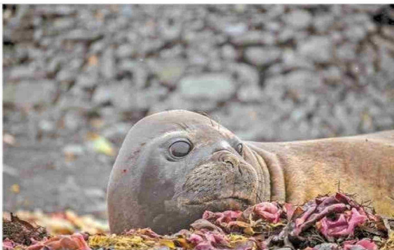
Un Elefante Marino cerca de la base Prat.

Foca Cangrejera ( Lobodon carsinophagu ); Focas de Weddell ( Leptonychotes weddellii ); Foca Leopardo ( Hydrurga leptenix ) y Foca de Ross ( Ommatophoca Rossii ).